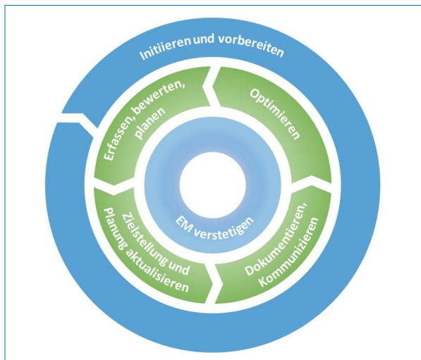
Aufgaben des / der Energiemanager:in